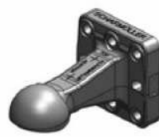
полусфера для шара Ø80