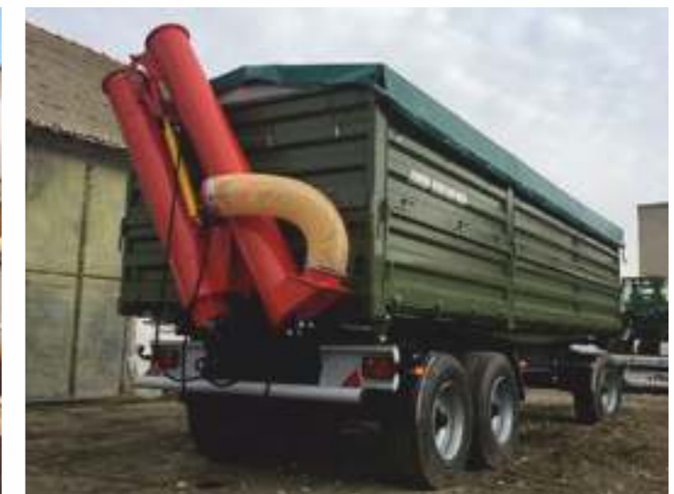
Шнеки для прицепов с задней разгрузкой