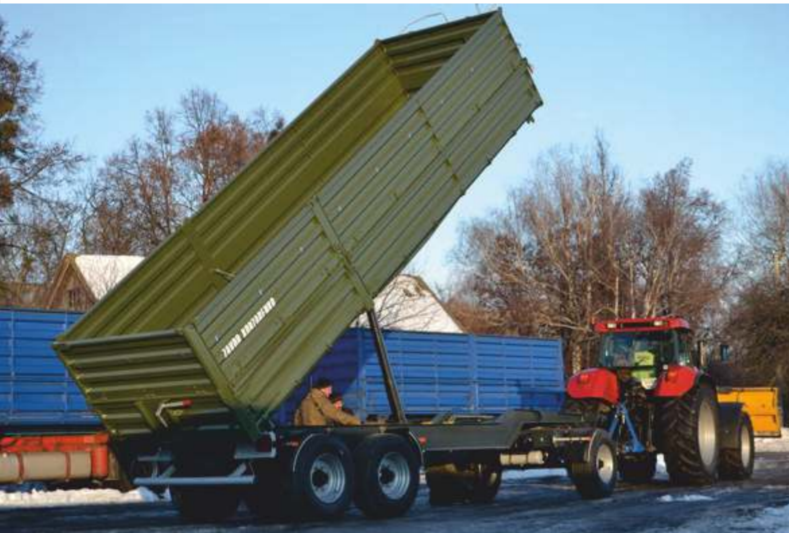
Прицеп ЗТСП-24 с трехсторонней разгрузкой