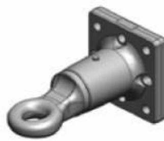
поворотная петля Ø50