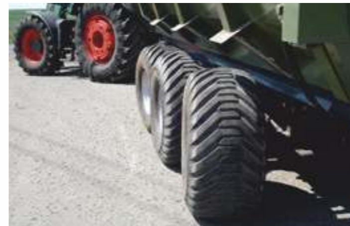
Первая и последняя ось подруливающие