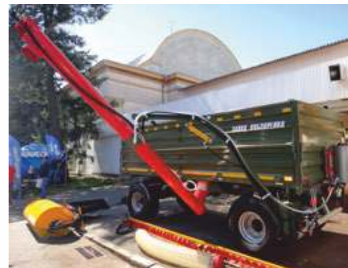
Шнеки для прицепов с боковой разгрузкой